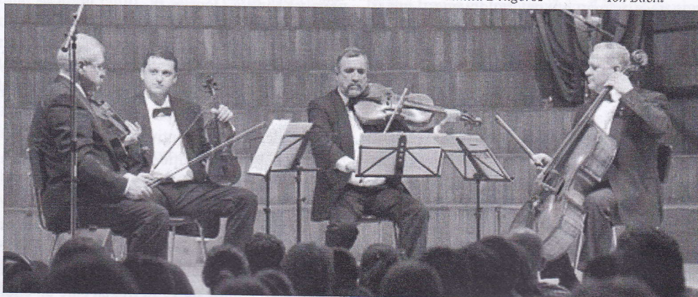
Cvartetul Voces (Filarmonica Moldova)